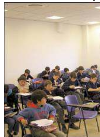
La primera etapa incluyó cuatro problemas a resolver.